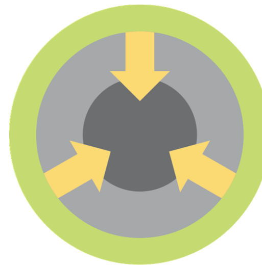
C – Vöxtur inn á við