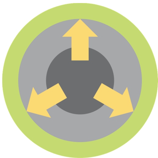
A – Vöxtur út á við