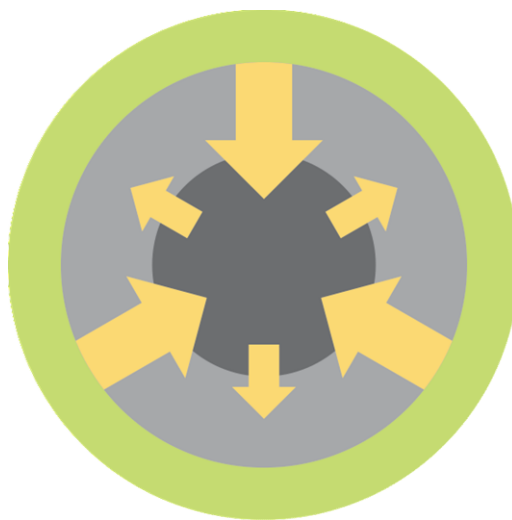
B – Vöxtur mestur inn á við