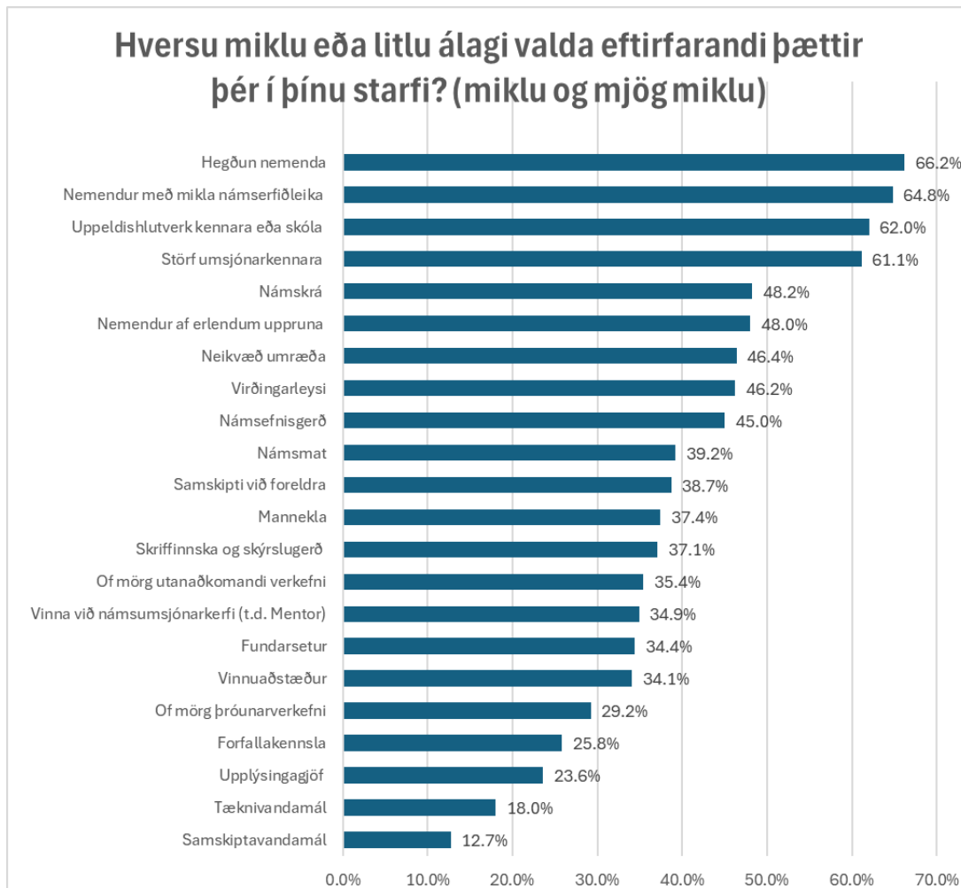
Mynd 3: Svör við spurningu um helstu álagsþætti. N=1098–1802).

Í spurningakönnuninni var spurt um fleiri álagsþætti en þá sem nefndir voru í könnuninni sjálfri og gáfu þeir rúmlega 800 viðbótarsvör sem flest voru áréttingar um þau atriði sem búið var að taka afstöðu til og eins svöruðu margir þessu neitandi. Athygli vekur að í tæplega 50 svörum er vikið að álagi vegna myglu! Þá er rétt að taka fram að nokkrir, m.a. skólastjórnendur og náms- og starfsráðgjafi gagnrýna að könnunin sé of kennaramiðuð og spurningar vanti um þeirra starf.