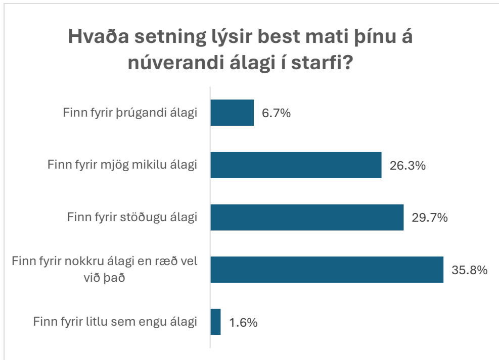
Mynd 1: Svör við spurningunni Hvaða setning lýsir best mati þínu á núverandi álagi í starfi? N=1920.

Í spurningakönnuninni var spurt hvað setning lýsti best mati á núverandi álagi í starfi. Niðurstöður má sjá á mynd 1: