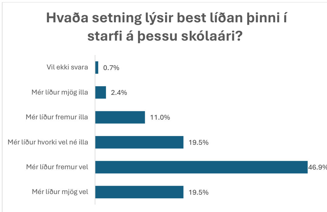
Mynd 2: Svör við spurningunni Hvaða setning lýsir best líðan þinni í starfi á þessu skólaári . N=1915.

Þá var spurt um starfsanda með því að biðja um afstöðu til þessarar fullyrðingar: Starfsandi er góður í skólanum þar sem ég starfa og voru 79,1% svarenda sammála því að hann væri góður.